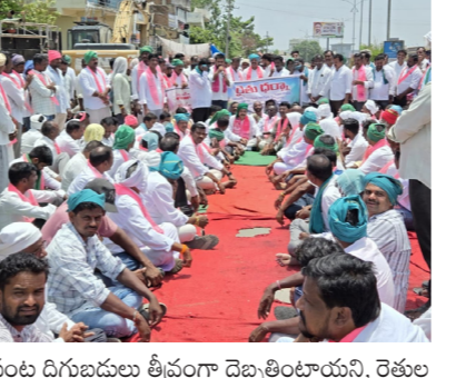
పంట దిగుబడులు తీవ్రంగా దెబ్బతింటాయని, రైతుల ఆర్థిక పరిస్థితి మరింత క్షీణిస్తే ప్రమాదం ఉందని హెచ్చరించారు. యాప్ రిజిస్ట్రేషన్ కోసం నెట్ సెలక్షన్ చట్టా తిరగి, రావడం వల్ల రైతులపై అదనపు భారం పడుతోందని తెలిపారు. సాంకేతికత రైతుకు సాయం చేయాలి... కానీ అతనికి అర్థంకాని మార్కెటింగ్ అని స్పష్టం చేసిన ఆయన, గతంలో అమల్లో ఉన్న విధంగా యూరియా కొనుగోలును యాప్ తో అనుసంధానం చేయడం వల్ల గ్రామీణ రైతులు తీవ్రమైన ఇబ్బందులు ఎదుర్కొంటున్నారని, ఇది రైతు వ్యతిరేక నిర్ణయమని విమర్శించారు. సార్వజనీన పని చేస్తున్న నిరక్షరాస్య రైతులు యాప్ విధానంతో తీవ్రంగా ఇబ్బంది పడుతున్నారని, సమాచార ప్రక్రియ వారికి అందని ద్రాక్షగా మారిందని అన్నారు. గ్రామీణ ప్రాంతాల్లో సరైన నెట్ వర్క్ సదుపాయం లేకపోవడం, సర్కల్ సమస్యల తరచూ ఎదురవడం వల్ల రైతులు ఎదుర్కొంటున్న ఇబ్బందులు నేరుగా యూరియా అందించే పద్ధతిని తిరిగి అమలు చేయాలని డిమాండ్ చేశారు. రెండు రోజుల్లో ఎల్లారెడ్డి నియోజకవర్గంలోని అన్ని కేంద్రాల్లో యూరియా అందుబాటులోకి తీసుకురావాలని ప్రభుత్వాన్ని హెచ్చరించారు. లేకపోతే రైతులకు ఏకం చేసి భారీ స్టాక్ ఉధృతాలు చేపట్టి ప్రభుత్వాన్ని స్తంభింపజేస్తామని స్పష్టం చేశారు. ధర్నా కార్యక్రమంలో పెద్ద సంఖ్యలో రైతులు పాల్గొని తమ ఆవేదనను వ్యక్తం చేశారు. యాప్ రద్దు చేయాలి - రైతును కాపాడాలి అనే నినాదాలతో వ్యక్తం చేశారు. సకాలంలో యూరియా అందకపోతే ప్రాంతం మారుమోగింది.

చట్టం / ఎల్లారెడ్డి : యూరియా సరఫరాను యాప్ కు పరిమితం చేయడంతో రైతులు ఎదుర్కొంటున్న ఇబ్బందులపై ఎల్లారెడ్డి మండలం గురువారం ఆగ్రావంతో మిస్సంటింది. రైతుల సమస్యలకు పరిష్కారం కోరుతూ నిర్వహించిన ధర్నా కార్యక్రమం ఉద్యమి వాతావరణంలో సాగింది. ఈ ఆందోళనలో మాజీ ఎమ్మెల్యే జాబాల సురేందర్ పాల్గొని రైతులకు మద్దతు తెలుపుతూ ప్రభుత్వ విధానాలపై తీవ్రంగా విమర్శించారు. ఈ సందర్భంగా ఆయన మాట్లాడుతూ... రైతులను మోసం చేసే ప్రయత్నం చేయడం వల్ల గ్రామీణ రైతులు తీవ్రమైన ఇబ్బందులు ఎదుర్కొంటున్నారని, ఇది రైతు వ్యతిరేక నిర్ణయమని విమర్శించారు. సార్వజనీన పని చేస్తున్న నిరక్షరాస్య రైతులు యాప్ విధానంతో తీవ్రంగా ఇబ్బంది పడుతున్నారని, సమాచార ప్రక్రియ వారికి అందని ద్రాక్షగా మారిందని అన్నారు. గ్రామీణ ప్రాంతాల్లో సరైన నెట్ వర్క్ సదుపాయం లేకపోవడం, సర్కల్ సమస్యల తరచూ ఎదురవడం వల్ల రైతులు ఎదుర్కొంటున్న ఇబ్బందులు నేరుగా యూరియా అందించే పద్ధతిని తిరిగి అమలు చేయాలని డిమాండ్ చేశారు. రెండు రోజుల్లో ఎల్లారెడ్డి నియోజకవర్గంలోని అన్ని కేంద్రాల్లో యూరియా అందుబాటులోకి తీసుకురావాలని ప్రభుత్వాన్ని హెచ్చరించారు. లేకపోతే రైతులకు ఏకం చేసి భారీ స్టాక్ ఉధృతాలు చేపట్టి ప్రభుత్వాన్ని స్తంభింపజేస్తామని స్పష్టం చేశారు. ధర్నా కార్యక్రమంలో పెద్ద సంఖ్యలో రైతులు పాల్గొని తమ ఆవేదనను వ్యక్తం చేశారు. యాప్ రద్దు చేయాలి - రైతును కాపాడాలి అనే నినాదాలతో వ్యక్తం చేశారు. సకాలంలో యూరియా అందకపోతే ప్రాంతం మారుమోగింది.